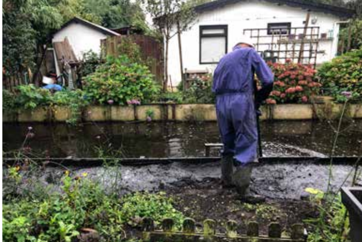
Belangrijk werk: het baggeren van de sloten. Ook de kas van de soeptuin wordt goed onderhouden.